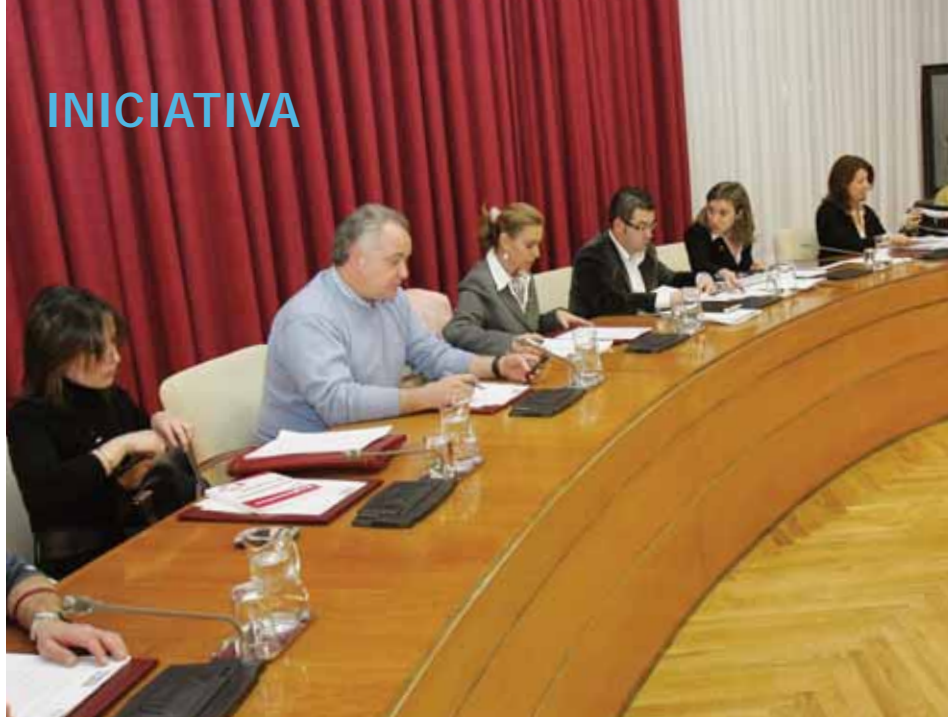
Imagen del Pleno de Logroño