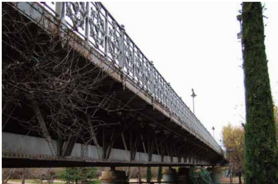
Puente de Hierro

La finalidad es una mayor eficiencia en el consumo sin que disminuya la calidad de los servicios que se atienden en cada dependencia municipal. La propuesta del Partido Popular incluye que el plan de ahorro pueda ponerse en marcha a lo largo del próximo año.