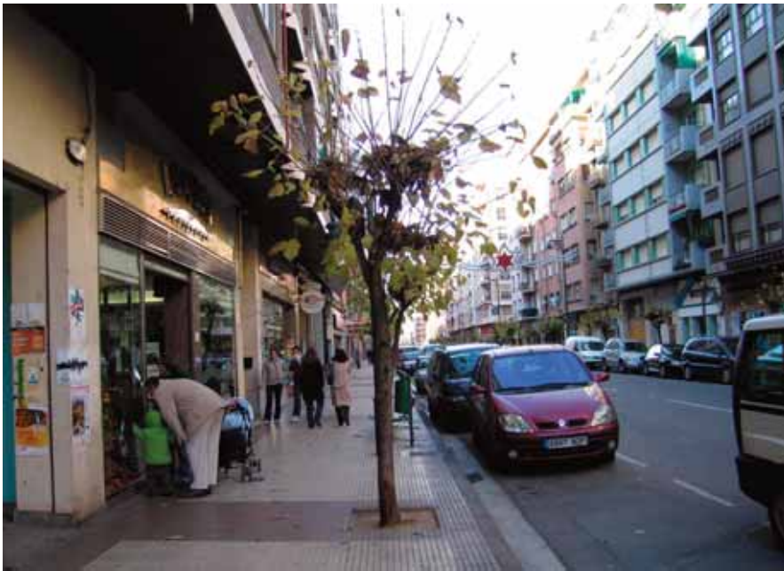
En la calle Huesca, se van a talar 212 catalpas