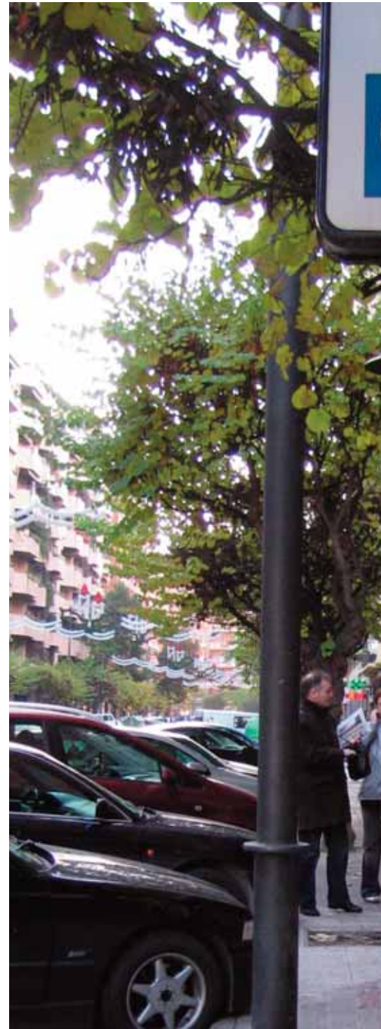
La nueva ordenanza incrementa las multas en un 606%, 602% y

PSOE y PR dicen que crean 1.000 aparcamientos en superficie en zona verde, pero lo que hacen es pintar las rayas que ahora son blancas. “Mienten porque lejos de 1.000 aparcamientos, lo que sí van a crear son 1.000 problemas diarios a los residentes del centro”, afirmó Merino.