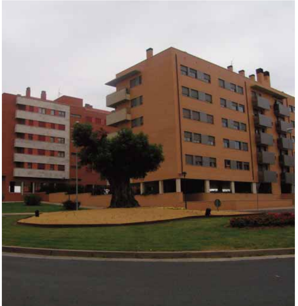
El PP propuso que se incluyese en 2008 más inversiones en los nuevos barrios como El Arco