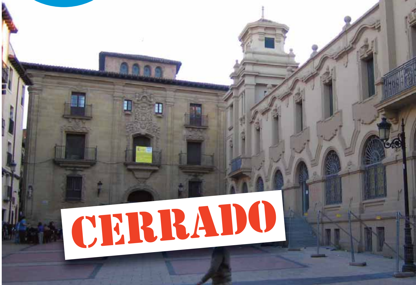
Los edificios del Museo y de Correos son la esquina 'Z', de gestión ineficaz y desvergüenza (con Z), en Logroño con obras paradas.